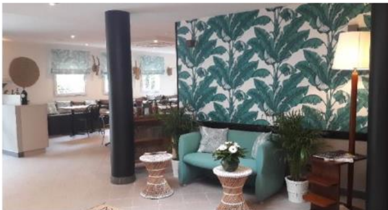
Nouveau lobby d'un hôtel Altica

Le coût global de cet investissement est de 4 millions d'euros , avec 4 hôtels (Arcachon, Villenave d'Ornon, Floirac, Anglet) relookés à la fin 2017, et deux (La Teste de Buch, La Rochelle) à suivre en 2018 .